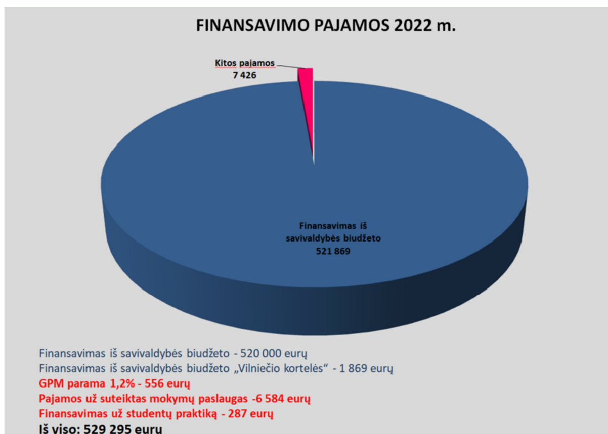
1 pav. Finansavimo pajamos

2022 m. už suteiktas mokymų paslaugas įstaiga uždirbo 6 584 Eur pajamų, o 2021 m. 1 768 Eur pajamų. Lyginant su 2021 m. uždirbtos pajamos padidėjo 4 816 Eur.